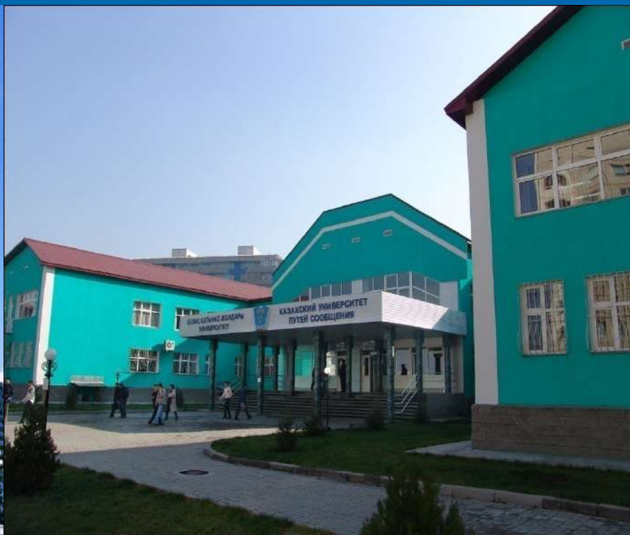
Учебные корпуса МТГУ