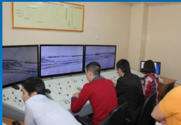
Лаборатория «Сортировочная горка»