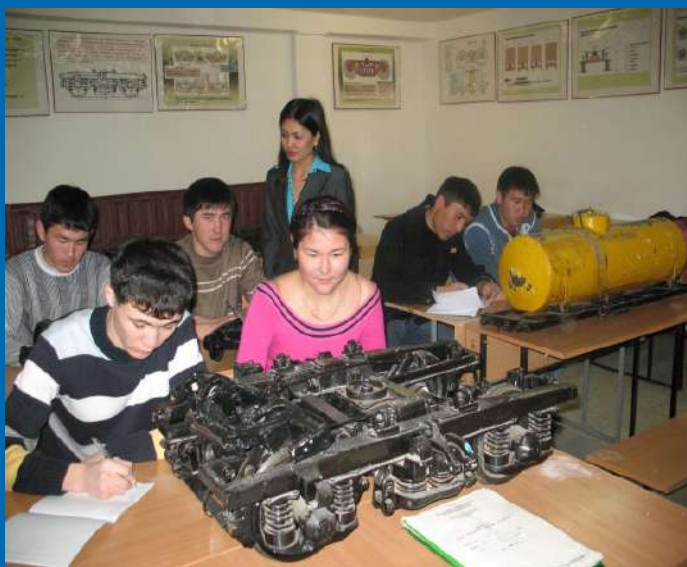
Лаборатория Подвижной состав

Развитие человеческого капитала путем обеспечения доступности качественного образования для устойчивого роста экономики.