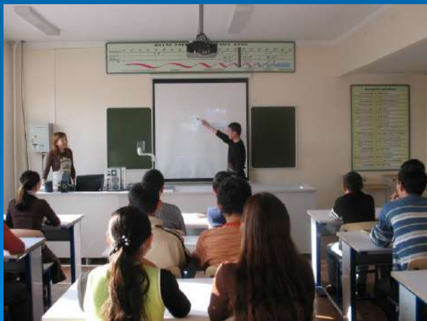
Кабинет физических процессов