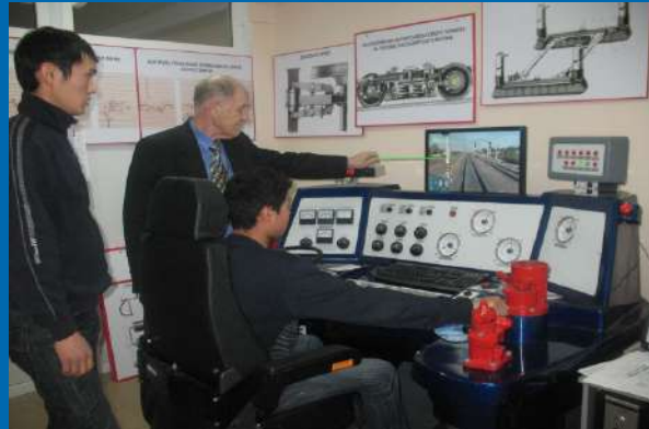
Виртуальная кабина машиниста