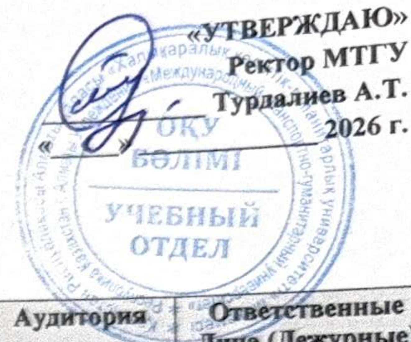
ГРАФИК сдачи экзаменационной сессии обучающимися 2- 3 курсов очной формы обучения (на базе высшего образования) 2 семестр 2025-2026 учебный год