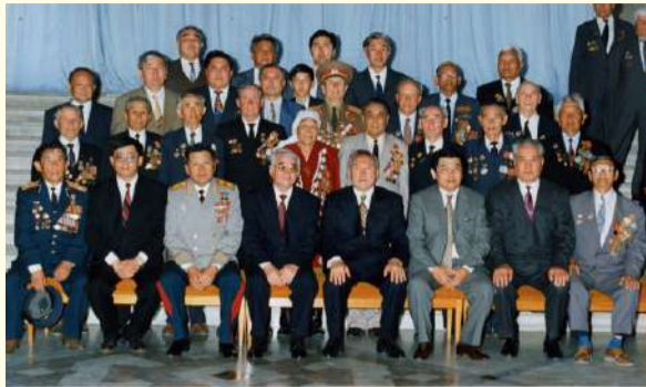
ДЕЛЕГАЦИЯ ТАЛДЫ-КОРГАНСКОЙ ОБЛАСТИ УЧАСТНИКОВ ВЕЛИКОЙ ОТЕЧЕСТВЕННОЙ ВОЙНЫ. 9 мая 1995 г. г. АЛМАТЫ

Кәсібилігіне келетін болсақ өмірде, өзінің еңбек жолында, іс-әрекетінде байыпты да байсалды. Шиеленіскен